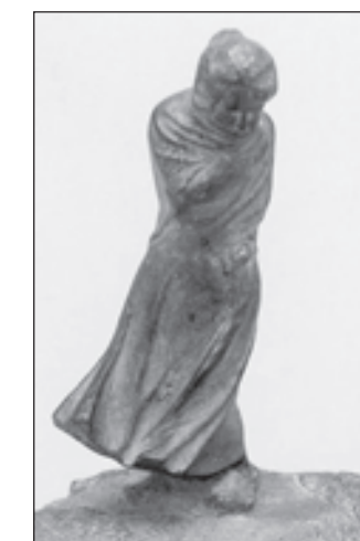
(ჭაპუს) შემოახლართავდა ფეხებზე და მექარე ღმერთს, ქარების მბრძანებელს შეევედრებოდა — ასე შეკარი შენი გამოგზავნილი ქარი, რომ ხეტიალს შეეშვას და თავის