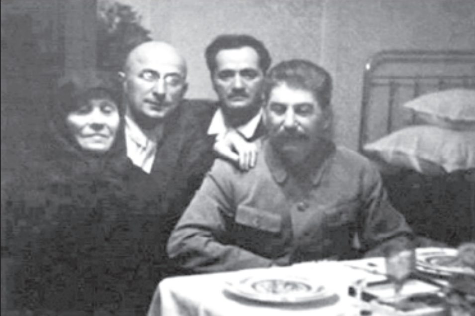
სტალინი, ბერია, სტალინის დედა - ქიქე, სტალინის პირადი ექიმი ნიკოლოზ ყიფშია. ფოტო გადაღებულია 1935 წელს

«ბერიამ და გადავანიშნა გადაწყვიტეს, რომ მთელი ბიუროკრატია დაეხმოს გვარის გადართქმნის და დაეხმოს გვარის გადართქმნის და დაეხმოს გვარის გადართქმნის...»