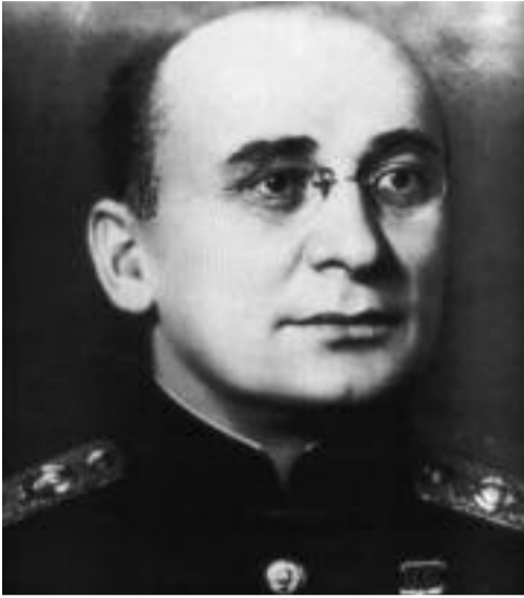
(გაგრძელება წინა ნომრიდან)

რამდენიმე კვირის შემდეგ ტკაჩენკო უჩვენებს ნოვიკოვს ბერიას სახელზე შედგენილ წერილს, სადაც შეთავაზებულია უაზრო საკადრო გადაადგილებები იარაღის მწარმოებელ ქარხნებში – ეს მოიხსნას, ეს შეიცვალოს. ნოვიკოვი ცდილობს აუხსნას ამ საქმის უაზრობა, მაგრამ ვერაფერს ხდება. რამდენიმე ხნის შემდეგ ნოვიკოვს ურეკავს ბერია და აძლევს შეკითხვებს. იგი კარგად უგებს ნოვიკოვს და ეუბნება, რომ ყურმილი გენერალს გადასცეს. ტკაჩენკო იღებს ყურმილს და ესმის საშინელი გინება: “რატომ გაგაგზავნე შე ასეთი და შე ისეთი ნოვიკოვთან – მისგან ჯაშუშურად შეგეგროვებინა ინფორმაცია თუ დახმარებოდა რეგულაციები? იცოდე, დახერხება არ ავცდებარა!” ტკაჩენკო დგას გაღურჯებული და ლულვლებს: “გისმენო, ამხანაგო სახალხო კომისარო!” ამის შემდეგ ტკაჩენკო საერთოდ გაქრდა...”